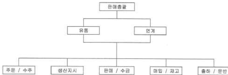
- 판매조직도 -